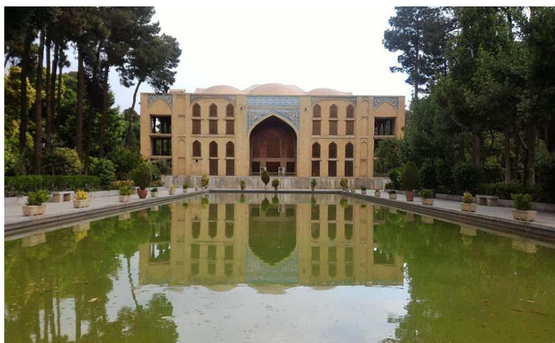
شکل ۵: کاخ چهلستون اصفهان

در نهایت، عناصر هویت بخش در معماری اصفهان نه تنها جلوه گر زیبایی های بصری هستند، بلکه نمایانگر فرهنگ، تاریخ و ارزش های اجتماعی ساکنان اصفهان نیز بشمار می رود. این عناصر، در تعامل با یکدیگر یک هویت فرهنگی مستحکم را برای این استان رقم زده اند که همچنان در زندگی روزمره مردم این استان جاری و تأثیرگذار است.