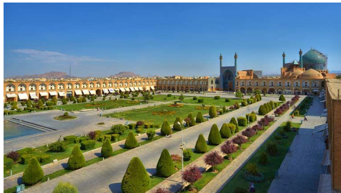
شکل ۲: میدان نقش جهان

طراحی میدان نقش جهان به‌عنوان بزرگ‌ترین میدان شهری در جهان، نمونه‌ای از توجه به فضاهای عمومی در معماری اصفهان است. این میدان نه تنها محلی برای تجمعات اجتماعی است، بلکه به‌عنوان نمادی از هویت جمعی و فرهنگی مردم اصفهان شناخته می‌شود. (کوروش مؤمنی، کورش عطاریان، زهره مسعودی، محمد دیده‌بان، ۲۰۱۸)