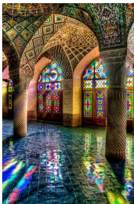
شکل ۴: مسجد نصیرالملک

نورپردازی در معماری اصفهان نیز یکی دیگر از عناصر هویت بخش است. استفاده هوشمندانه از نور طبیعی در طراحی فضاها، احساس آرامش و معنویت را در بناهای مذهبی ایجاد می کند. (مینا سلیمی، محمد شریف زاده، اسماعیل نبی اردلان، ۲۰۲۰)