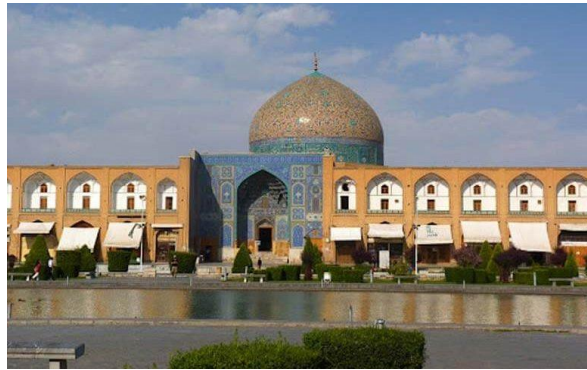
مسجد شیخ لطف‌الله شکل ۱: