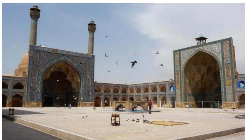
شکل ۳: مسجد جامع اصفهان