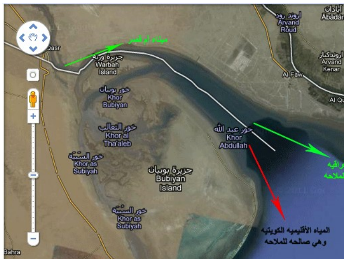
مؤسسة الموانئ الكويتية Kuwait Ports Authority