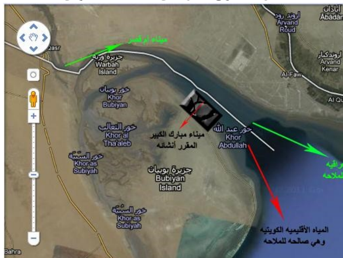
مؤسسة الموانئ الكويتية Kuwait Ports Authority