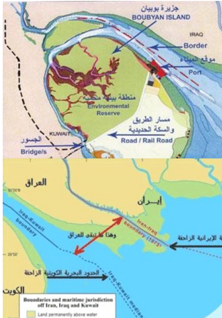
مؤسسة الموانئ الكويتية Kuwait Ports Authority

الشكل (٤): عرض يوضح المنفذ البحري الرئيسي للعراق المتنافس عليه من قبل الكويت الآن