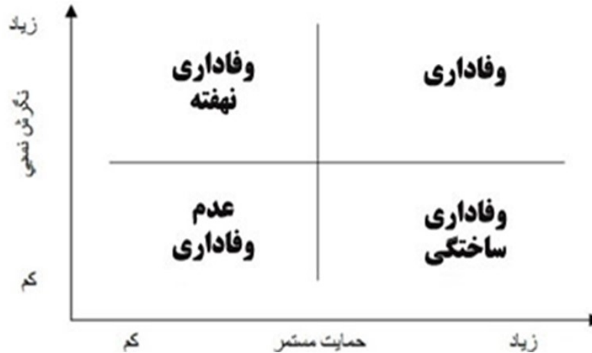
شکل (۲): طبقه بندی وفاداری بر اساس دو متغیر نگرش و رفتار

دیک و باسو ۱ تعامل نگرش و رفتار وفاداری را با طبقه بندی از مفهوم نگرش نسبی و حمایت مستمر و تکرار شده به صورت زیر شرح می دهند: وفاداری، وفاداری ساختگی، وفاداری نهفته و عدم وفاداری.