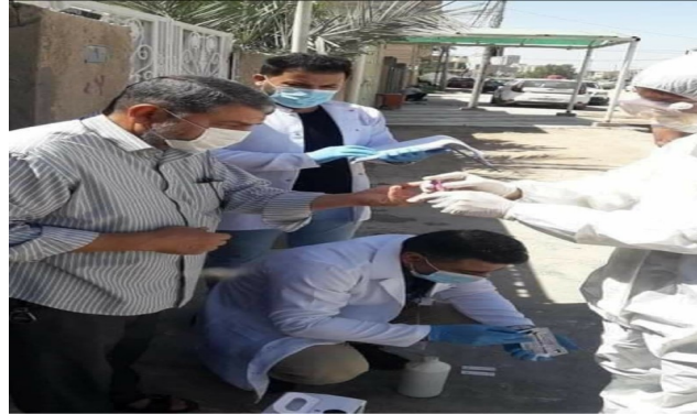
شكل (1) يوضح كادر صحة الديوانية عند اخذ عينات (مسحات) من الملامسين لمصابي كورونا

مجتمع الديوانية بضرورة الوعي والوقاية ولأن حالة تفشي مرض كورونا متعلق بالجهاز التنفسي لذلك من الضروري الالتزام بالحفاظ على نظافة اليدين ومراعاة أدب السعال وتجنب الاتصال الوثيق مع الأشخاص الذين تظهر عليهم أعراض أمراض الجهاز التنفسي وإبلاغ المركز الصحي عند الشعور بالمرض وقد يساهم الوعي العام بالفايروس واتخاذ التدابير والوقاية المعززة هي عناصر أساسية للوقاية من الإصابة بالعدوى.