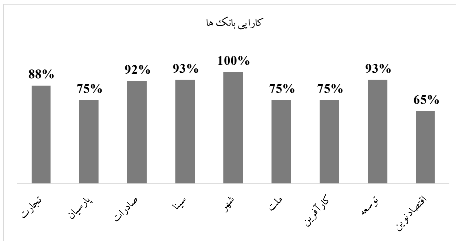
نمودار ۱: کارایی بانک‌های مورد مطالعه

طبق جدول ۱۱ کارایی بانک‌ها در شکل ۱ ارائه شده است.