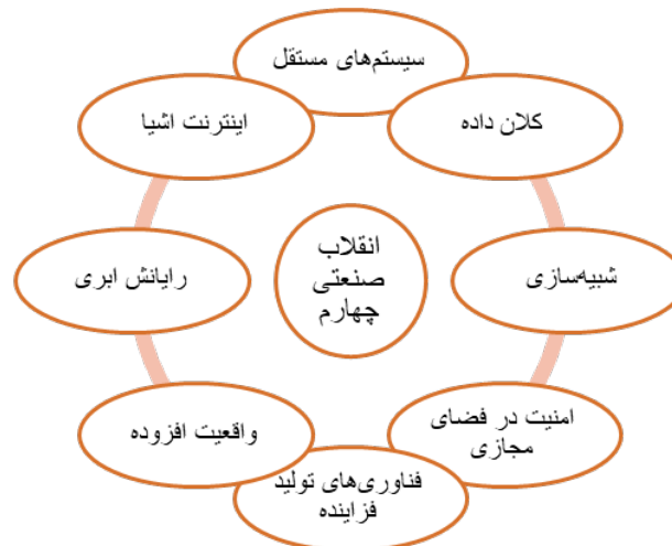
رسم توضیحی ۲- محورهای انقلاب صنعتی چهارم

جامعه نسل پنجم بر نه ستون بنا شده است. موضوع مهم درباره این جامعه جدید اهمیت انسان ها در آن است یعنی اگر در جوامع قبلی خود ابزارها مثل ماشین بخار یا برق اهمیت بیشتری داشت، این بار قرار است همه ابزارها در خدمت انسان و رسیدن به جامعه ای با محوریت انسان است (منسا ۲۰۱۹).