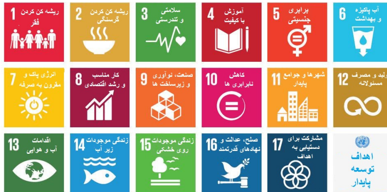
رسم توضیحی ۳ - اهداف توسعه پایدار سازمان ملل متحد (مرکز اطلاعات سازمان ملل متحد ۲۰۱۶)