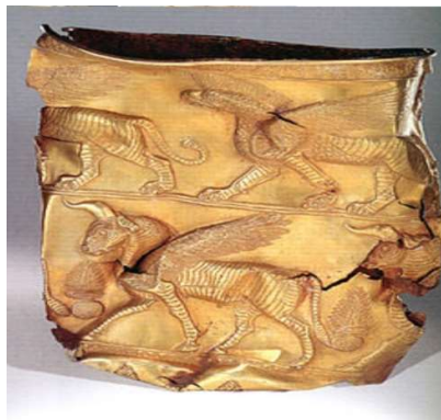
«جام طلایی مارلیک»

سگزآباد پیدا کرد. جام طلایی مارلیک، با نقش گاوهای بالدار در دو سوی درخت تزیینی که متعلق به قرن ۱۲ تا ۱۱ پ. م بوده است به عقیده برادا رابطه‌ی نزدیکی با هنر ایلامی دارد.