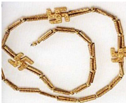
«گردنبند طلا مکشوفه از گیلان هزاره اول پیش از میلاد - موزه ایران باستان»

همان‌طور که می‌دانیم صلیب شکسته یا سواسیتیکا (Swasitika) ریشه‌ای کاملاً ایرانی دارد که به آن گردونه مهر نیز گفته می‌شود. قدمت آن به سال‌ها پیش از هخامنشیان باز می‌گردد.