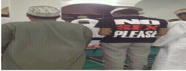
قميص مكتوب عليه NO SEX PLEASE

ومن حيث لا يدري وجد الشباب الجزائري المسلم نفسه يقتنى ويلبس رموزا تتنافى مع عقيدته وثقافته بسبب الجهل والغفلة، بل ويدخل بها المساجد وتلك هي الكارثة، لاحظ الصورة