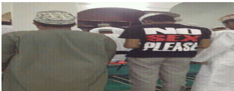
قميص مكتوب عليه NO SEX PLEASE

ومن حيث لا يدري وجد الشباب الجزائري المسلم نفسه يقتنى ويلبس رموزا تتنافى مع عقيدته وثقافته بسبب الجهل والغفلة، بل ويدخل بها المساجد وتلك هي الكارثة، لاحظ الصورة