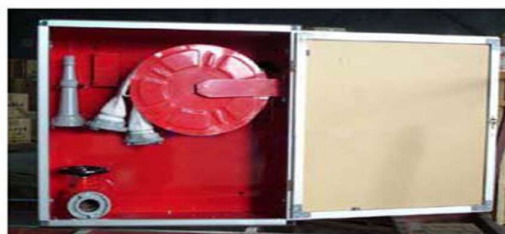
ب: شبکه خاموش کننده مبتنی بر آب (شبکه افشانه‌ای - Sprinkler)، کف، CO 2 ، پودر، ترکیبات هالوژنه