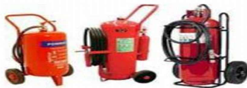
د: خاموش کننده‌های بزرگ خودرویی یا قایق حمل توسط کشتی‌های اطفاء حریق یا هواپیما تجهیزات ثابت: شامل تجهیزاتی هستند که قابل انتقال در مکان‌های مختلف نیستند که سه نوع می‌باشد: