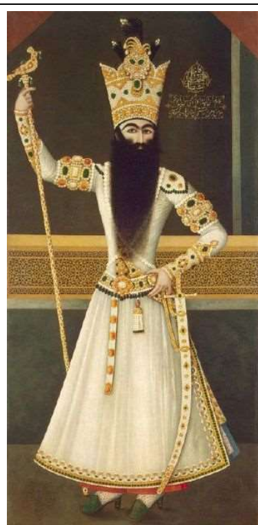
فتحعلیشاه ایستاده با عصای شاهی، اثر مهرعلی، رنگ و روغن روی بوم، ۱۲۲۶ هجری قمری منبع (علیمحلی اردکانی، ۱۳۹۲، ۲۰۱)

در تصویر ۳، فتحعلیشاه زانو زده در مرکز تصویر جای گرفته است. لباس او در اینجا به رنگ قرمز که مزین به جواهراتی با رنگهای قرمز، سبز، زرد و سفید می‌باشد. پس زمینه این نقاشی نیز همانند تصاویر پیشین از رنگهای زرد شکل گرفته است.