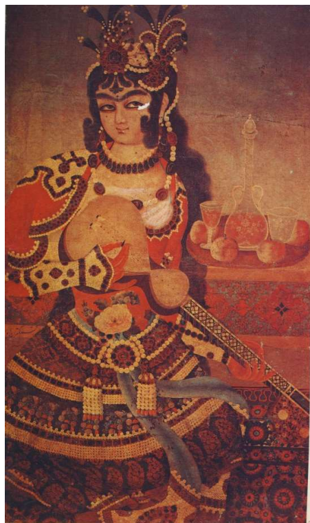
دختری گیتار می نوازد، دوره فتحعلیشاه منبع: (Falk,1972,20)