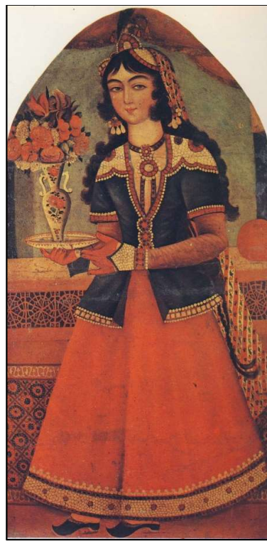
دختر با گلدان، رنگ و روغن روی بوم، دوره فتحعلیشاه