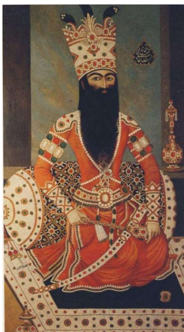
فتحعلیشاه نشسته، منسوب به مهرعلی