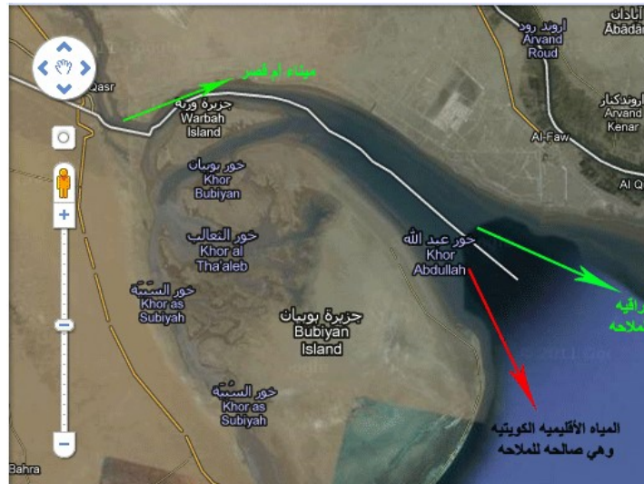
الشكل (2) يوضح اتجاه السفن إلى ميناء أم قصر قبل إنشاء ميناء مبارك الكويتي

مؤسسة الموانئ الكويتية Kuwait Ports Authority