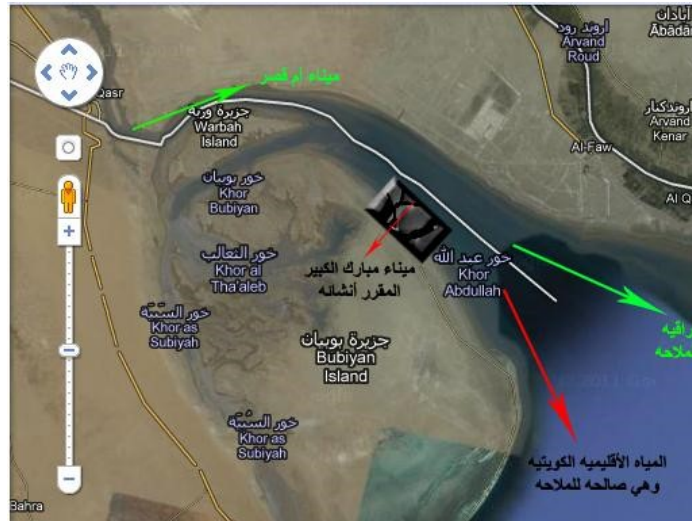
الشكل (1) الموقع الاستراتيجي لميناء مبارك الكويتي

مؤسسة الموانئ الكويتية Kuwait Ports Authority