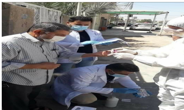
شكل (1) يوضح كادر صحة الديوانية عند اخذ عينات (مسحات) من الملامسين لمصابي كورونا

مجتمع الديوانية بضرورة الوعي والوقاية ولأن حالة تفشي مرض كورونا متعلق بالجهاز التنفسي لذلك من الضروري الالتزام بالحفاظ على نظافة اليدين ومراعاة أدب السعال وتجنب الاتصال الوثيق مع الأشخاص الذين تظهر عليهم أعراض أمراض الجهاز التنفسي وإبلاغ المركز الصحي عند الشعور بالمرض وقد يساهم الوعي العام بالفايروس واتخاذ التدابير والوقاية المعززة هي عناصر أساسية للوقاية من الإصابة بالعدوى.