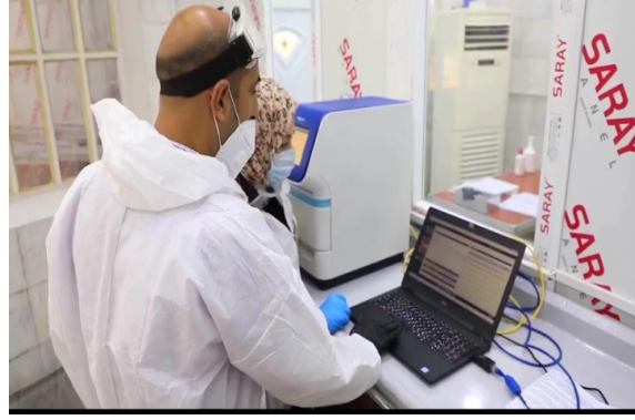
شكل (٣) يوضح كادر صحة الديوانية عند فحص عينات (مسحات) واستخدام جهاز PCR (صفحة مديرة صحة الديوانية)