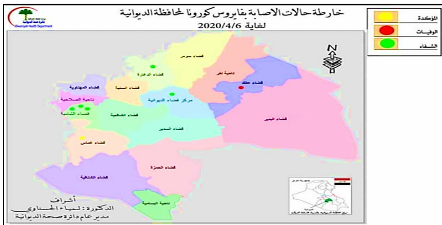
صفحة مديرية صحة الديوانية (موقع وزارة الصحة والبيئة)