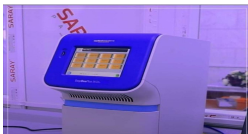
شكل (2) يوضح جهاز PCR