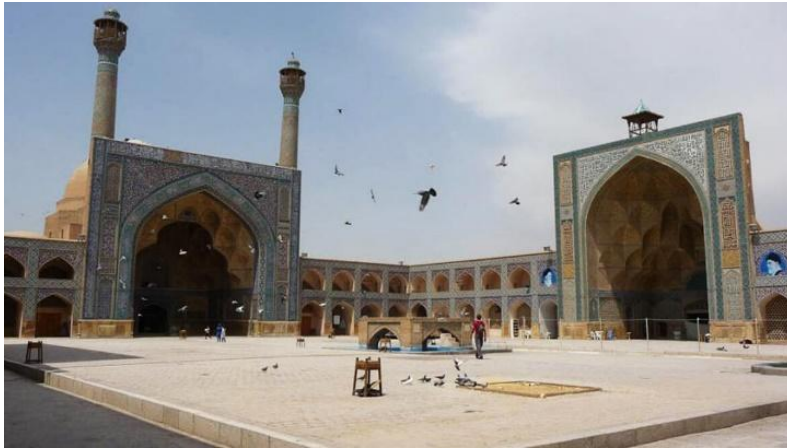
شکل ۳: مسجد جامع اصفهان