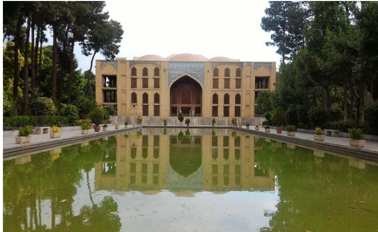
شکل ۵: کاخ چهلستون اصفهان

در نهایت، عناصر هویت بخش در معماری اصفهان نه تنها جلوه گر زیبایی های بصری هستند، بلکه نمایانگر فرهنگ، تاریخ و ارزش های اجتماعی ساکنان اصفهان نیز بشمار می رود. این عناصر، در تعامل با یکدیگر یک هویت فرهنگی مستحکم را برای این استان رقم زده اند که همچنان در زندگی روزمره مردم این استان جاری و تأثیرگذار است.